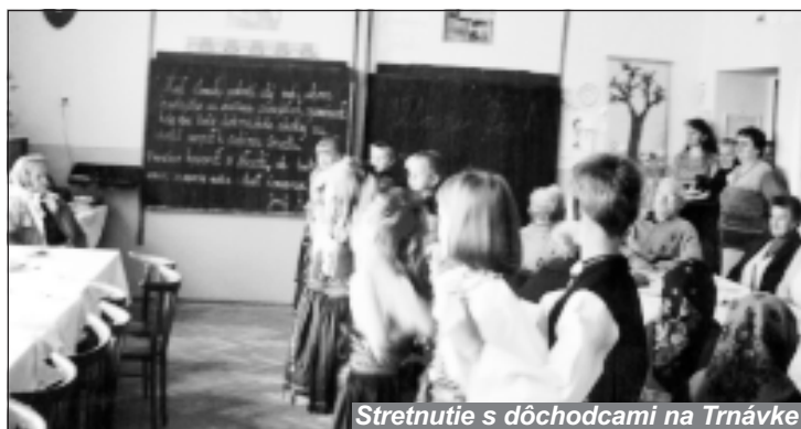
Stretnutie s dôchodcami na Trnávke